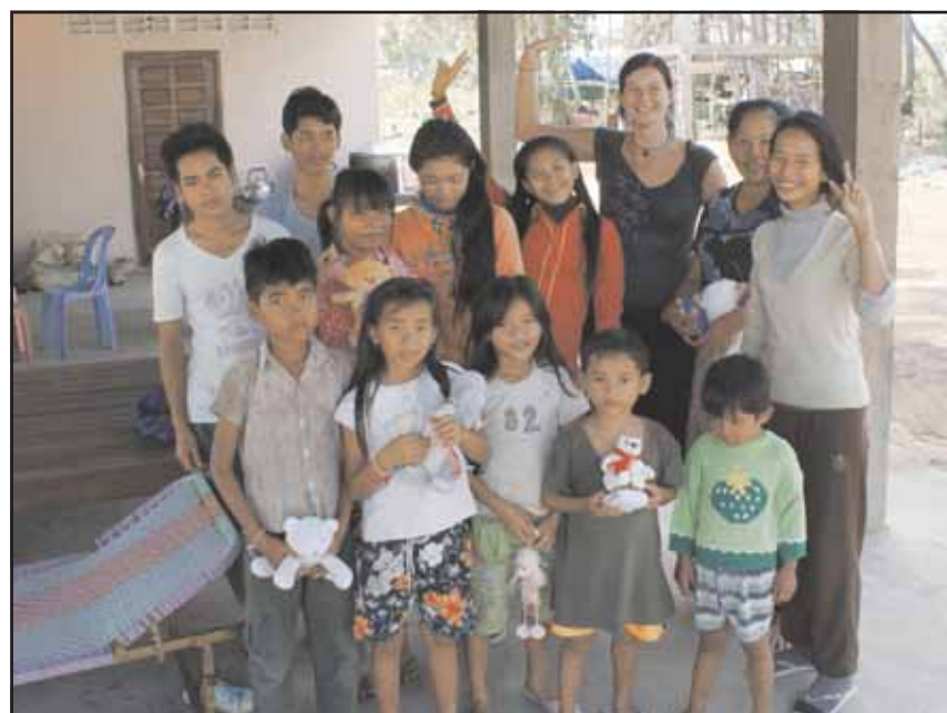
Foto mit den Kindern von Thalaborevat

Weitere Informationen zur Hilfsorganisation: www.beebob-hilfe.de