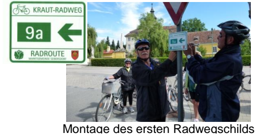
Montage des ersten Radwegschildes

Das bestehende Leitsystem, das teilweise schon ziemlich desolat war, wurde saniert und aktualisiert, nicht mehr bestehende Firmen wurden entfernt und neu angesiedelte ergänzt sowie Hinweistafeln auf den Radweg hinzugefügt.