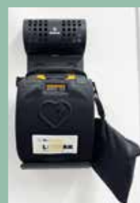
Defi FF Haus Sbd