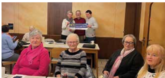
Die Senioren beim „Handy-Workshop“

Im Rahmen der Digitalisierungsoffensive des Bundes, deren Ziel es ist, dass bis 2030 möglichst alle Menschen in Österreich über grundlegende digitale Kompetenzen verfügen, um die Wachstumspotenziale der Digitalisierung bestmöglich nutzen zu können, haben 23 Seniorinnen und Senioren aus Seibersdorf und Deutsch-Brodersdorf im Gasthaus Grätzer einen äußerst informativen Handy-Workshop zum Thema „WhatsApp“ absolviert.