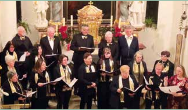
Die Singgemeinschaft Seibersdorf beim Adventsingen in der Pfarrkirche Seibersdorf