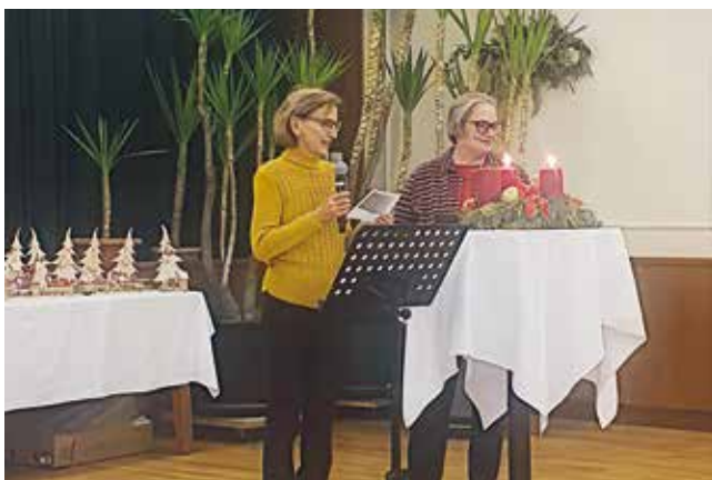
Die Weihnachtsfeier der NÖ Senioren Deutsch-Brodersdorf