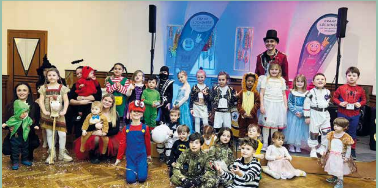
Die Besucherinnen und Besucher des Kindermaskenballs in Seibersdorf

Es war ein rundum bunter Nachmittag für Groß und Klein! Der Elternbeirat bedankt sich bei allen Mitwirkenden, Gästen und Sponsoren, die dies ermöglicht haben!