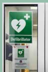
Defi FF Haus Sbd Außenansicht