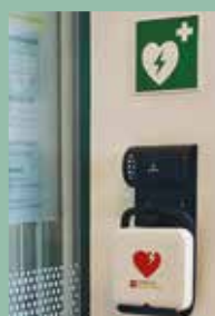
Defi RAIKA D-B

Keine Angst! Der Defi gibt akustische Anweisungen und führt Schritt für Schritt durch die Anwendung.