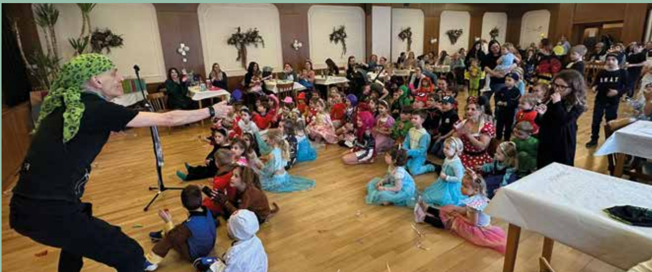
Die Besucherinnen und Besucher des Kindermaskenballs in Deutsch-Brodersdorf

Der Elternverein bedankt sich herzlich bei allen Besucherinnen und Besuchern für die zahlreiche Teilnahme sowie bei allen Unterstützerinnen und Unterstützern für die großzügigen Spenden. Durch dieses Engagement wurde der Kindermaskenball auch heuer wieder zu einem vollen Erfolg und zu einem unvergesslichen Faschingserlebnis für unsere Kinder.