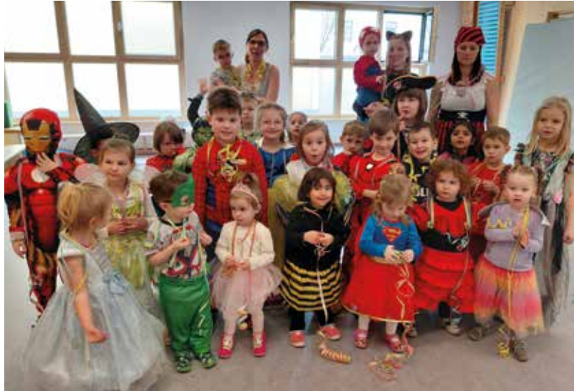
Die Kindergartenkinder des Landeskindergartens Seibersdorf

der Jänner/Februar auch schon wieder wie im Flug vergangen. Stolz haben die Kinder auch von der Schuleinschreibung erzählt, wo sie ihre erarbeiteten Portfolioblätter herzeigen konnten.