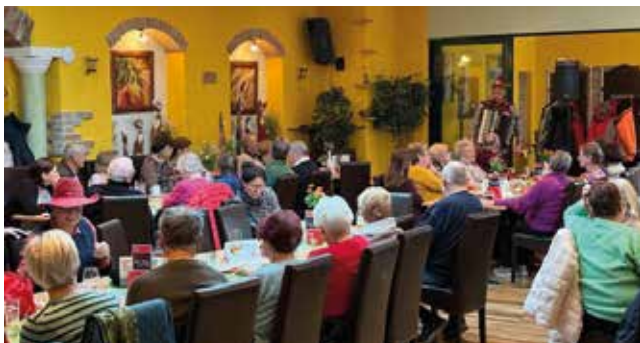
Die NÖ Senioren der Ortsgruppe Seibersdorf und Deutsch-Brodersdorf beim Heringsschmausbuffet