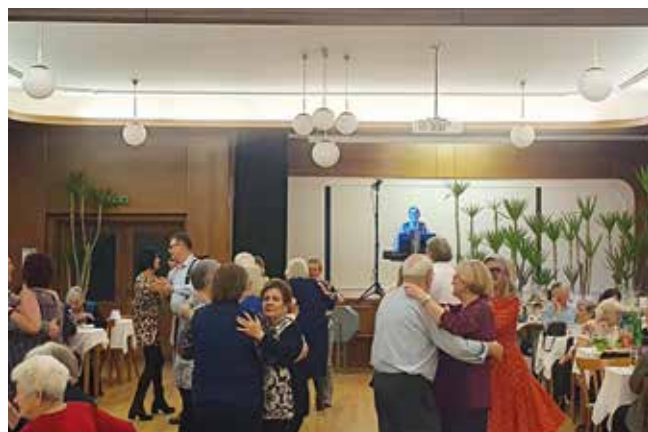
Das Faschingskränzchen der NÖ Senioren Deutsch-Brodersdorf