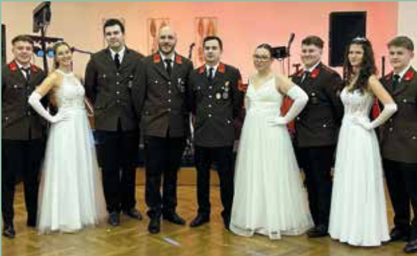
Die Feuerwehr Seibersdorf mit den Eintänzerinnen und Eintänzern der Jugend

Am Samstag, den 17. Jänner 2026, fand der all-jährliche Feuerwehrball der Feuerwehr Seibersdorf traditionsgemäß im Gasthaus Hirschbeck statt. Für beste musikalische Unterhaltung und eine großartige Atmosphäre im voll besetzten Ballsaal sorgte in diesem Jahr erneut die Band M&M. Gegen 21:00 Uhr eröffneten die hervorragend vorbereiteten Eintänzerinnen und Eintänzer der Jugend Deutsch-Brodersdorf/Seibersdorf den Ball und brachten mit ihrer beeindruckenden Darbietung den Saal so richtig in Schwung. Die Feuerwehr Seibersdorf bedankt sich herzlich bei den zahlreichen Gästen, dem Gasthaus Hirschbeck, den Spenderinnen und Spendern der Tombola sowie der Jugend Deutsch-Brodersdorf/Seibersdorf. Die FF Seibersdorf freut sich schon jetzt auf das nächste Jahr!