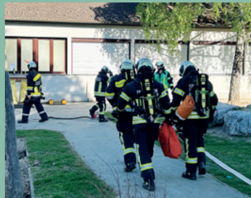
Die Kameraden der Freiwilligen Feuerwehren Deutsch-Brodersdorf und Seibersdorf bei der Atemschutzübung im alten Kindergartengebäude

Ein herzliches Danke geht an die Freiwillige Feuerwehr Deutsch-Brodersdorf für die Teilnahme an der gemeinsamen Übung.