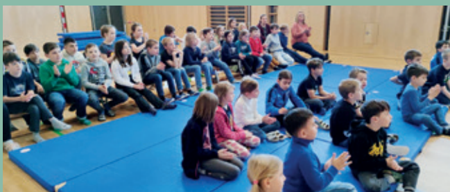
Die Schulkinder der Volksschule Seibersdorf während der Aufführung im Turnsaal