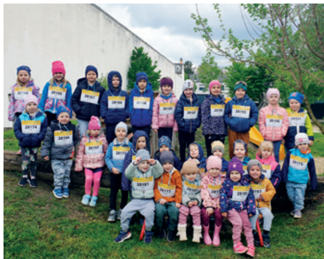
Die Kinder des Kindergartens Deutsch-Brodersdorf

Auch wir im Kindergarten haben uns entschieden, beim Lafevent der Krebshilfe mitzumachen. Jedes teilnehmende Kind hat eine Startnummer erhalten. Es galt dann 100 m Distanz zu absolvieren. Ein herzliches Dankeschön an den Elternbeirat. Dieser hat sich bereit erklärt, die Kosten des Startgeldes zu übernehmen.