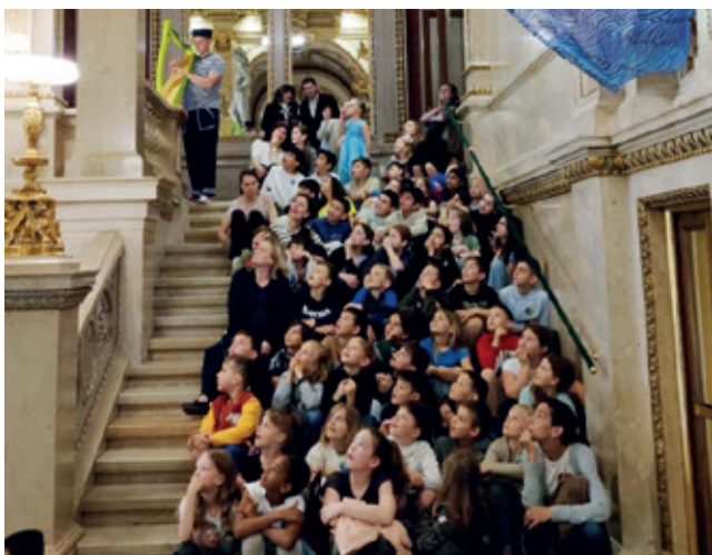
Die Schulkinder der Volksschule Seibersdorf in der Wiener Staatsoper

Vielen Dank an den Elternverein für die Finanzierung der Eintrittskarten und an die Marktgemeinde Seibersdorf, die wie in allen anderen Fällen wieder unsere Buskosten übernommen hat!