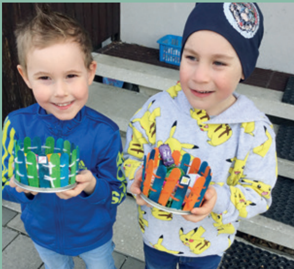
Die Kinder des Kindergartens Seibersdorf präsentieren ihr Osternest

Vor den Osterferien durfte das Osterfest natürlich nicht fehlen. Nach einer langen Suche der Osternester im Ort konnten wir dann im Garten des Kindergartens fündig werden. Die selbstgestalteten Nester wurden sofort präsentiert.