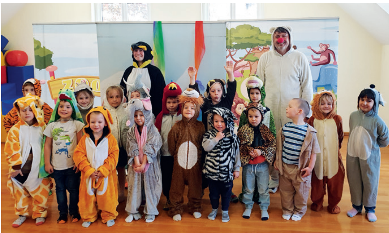
Die Kinder des Kindergartens Deutsch-Brodersdorf mit den Darstellern des Mitmachtheaters

Ein weiteres Highlight im April war der Besuch des Mitmachtheaters Harlekin. Aufgeführt wurde das Stück „Unser kunterbunter Zoo“. Das Besondere daran war, dass die Kinder dabei aktiv mitwirken konnten. So verwandelten sich einige unserer Kinder in Zootiere. Gemeinsam mit den Darstellern boten sie den Zusehern eine tolle Darbietung. Auch hierfür hat der Elternbeirat die Kosten übernommen. Vielen Dank dafür.