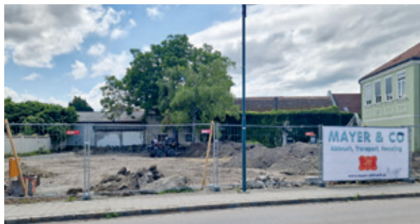
Das alte Gebäude des Kindergartens in Seibersdorf wurde bereits abgerissen. Im Sommer 2024 wird mit dem Neubau begonnen.