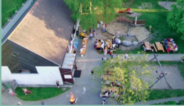
Kindergartenfest in Seibersdorf

Am Freitag, dem 12.04.2024 lud die Gemeinde kurz vor Beginn der Abbrucharbeiten ein, vom Kindergarten Abschied zu nehmen. Viele „ehemalige“ Kindergartenkinder der letzten sechs Jahrzehnte sind dem Aufruf gefolgt und konnten bei optimalem Wetter, Würsteln und Erfrischungsgetränken in Erinnerungen schwelgen und sich den Plan für den Neubau ansehen. Im Vorfeld für Spannung sorgte die angekündigte Überraschung, „die bislang verboten war“. Die Freude und der Spaß der Kinder waren natürlich groß, als sie nach Lust und Laune Wände beschmieren und sich ein letztes Mal im „alten“ Kindergarten austoben durften. Im Sinne der Nachhaltigkeit wurden auch alle noch im Kindergarten befindlichen (und sonst zu entsorgenden) Teile zur Versteigerung angeboten, was von den Anwesenden bei den unglaublichsten Dingen in Anspruch genommen wurde. So blüht nicht nur dem Gartentor und der Betonstiege „ein Leben nach dem Abbruch“, sondern es wurden auch Vorhänge, Türen und vieles mehr von den Bestbietern in den Folgetagen abgeholt. Beim Lagerfeuer fand der Abend einen vielleicht etwas melancholischen, aber dennoch gemütlichen Ausklang. Sämtliche Einnahmen, Spenden und Erlöse der Versteigerung wurden zur Gänze an den Elternbeirat des Kindergarten Seibersdorf übergeben.