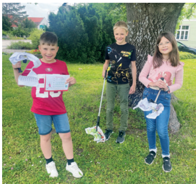
Die Schulkinder der Volksschule Seibersdorf beim Müllsammeln

Seit Neuem gibt es in der Schule eine neue Tauschbörse: Hier kann man nämlich seine ganze Hausübung gegen 45 Minuten Müll sammeln eintauschen! Das macht nicht nur großen Spaß, es fördert auch unser Zusammengehörigkeitsgefühl und hebt die Sozialkompetenz auf eine höhere Stufe. Ganz vorne aber stehen der Umweltgedanke und die Verantwortung der Natur gegenüber.