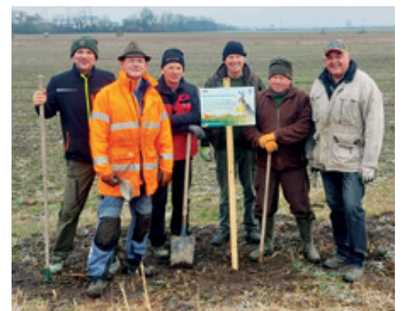
Die Jagdgesellschaft Seibersdorf

Bei der Errichtung der Kanalleitung im Jahr 2023 der Industriestraße wurden die Sträucher zum Großteil entfernt. Die Jagdgesellschaft Seibersdorf hat, gemeinsam mit der Marktgemeinde Seibersdorf als Grundbesitzer, die Wiederherstellung als sinnvoll erachtet um der Tierwelt eine Lebensraumverbesserung zu schaffen. Die Jagdgesellschaft Seibersdorf hat sich bei der Wild Ökoland Aktion des NÖ Landesjagdverbands beteiligt, und so konnte die Jagdgesellschaft Seibersdorf auf diesem Weg eine Unterstützung in Form einer 80% Förderung des Pflanzmaterials erhalten. Die Pflanzarbeiten sind im Spätherbst 2023 durchgeführt worden. Gemeinsam mit den beiden Firmen Wopfinger Transportbeton und Hermann Mayer Transporte wurden die Pflanzarbeiten umgesetzt.