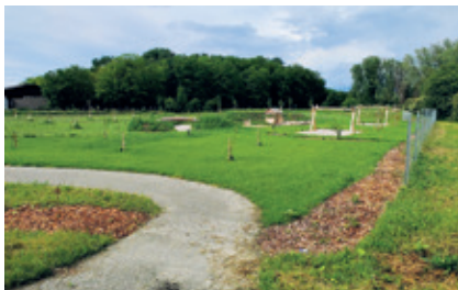
Naturspielplatz „An der Leitha“

Die Bauarbeiten sind fast abgeschlossen. Im Sommer 2024 wird der Spielplatz feierlich eröffnet.