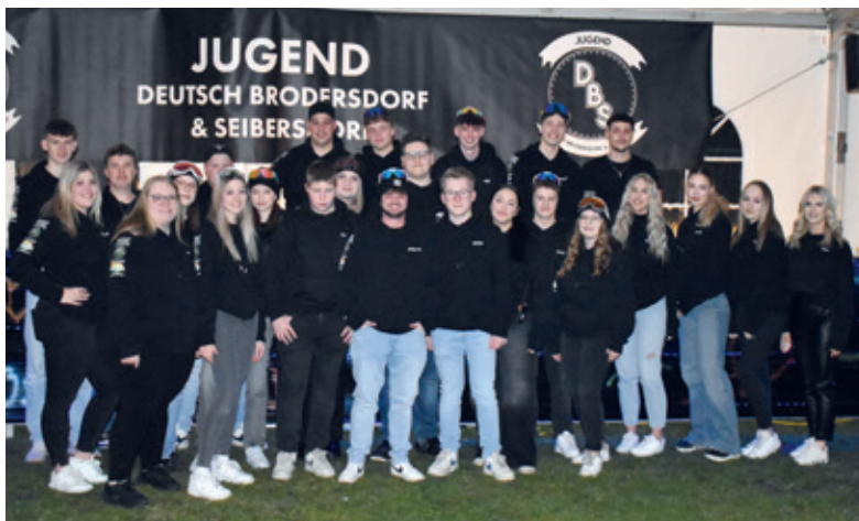
Jugend Deutsch-Brodersdorf/Seibersdorf bei der Après-Ski-Party

Wir würden uns auf Euer zahlreiches Erscheinen bei unseren Veranstaltungen freuen!