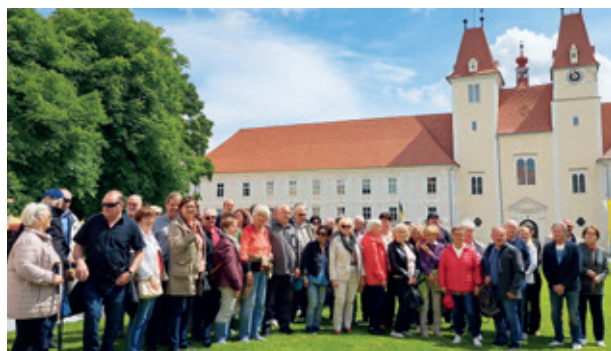
Die Teilnehmerinnen und Teilnehmer der Mutter-/Vatertagsfahrt

Die heurige Mutter-/Vatertagsfahrt führte die Teilnehmerinnen und Teilnehmer in das Stift Vraau. Gestartet wurde der Ausflug mit einer Andacht im Stift Vraau. Danach ging es weiter mit einer Führung durch das Stift Vraau. Nach dem gemeinsamen Mittagessen konnten bei herrlichem Wetter das Freilichtmuseum sowie der Hofladen Kolb mit vielen nachhaltigen Produkten bewundert werden. Zum Abschluss gab es eine Jause beim Brennerwirt. Die ÖVP Seibersdorf/Deutsch-Brodersdorf bedankt sich für die zahlreiche Teilnahme.