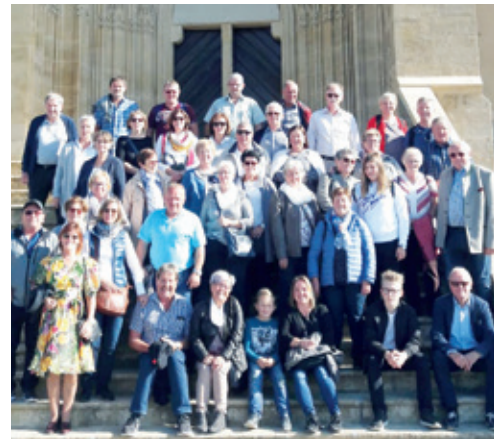
Die Chorgemeinschaft Deutsch-Brodersdorf