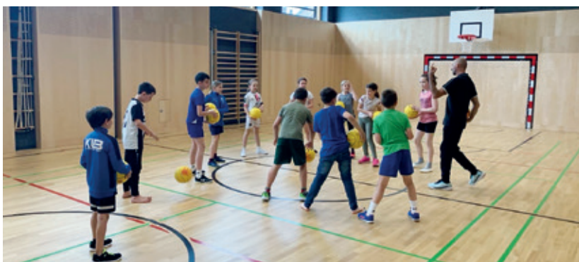
Die Schulkinder der Volksschule Seibersdorf während der Basketballereinheit mit dem Trainer

Die tägliche Turnstunde wird schon seit langer Zeit gefordert - leider ist diese noch nicht gesetzlich verankert. Dies hält die Schulkinder nicht davon ab, die eigene Fitness in Schuss zu halten. So lernen die Schulkinder durch Experten (aus den verschiedensten Vereinen) die unterschiedlichsten Sportarten kennen. Kürzlich konnten sie die beiden Ballsportarten Baseball und Basketball unter Anleitung zweier Trainer ausprobieren.