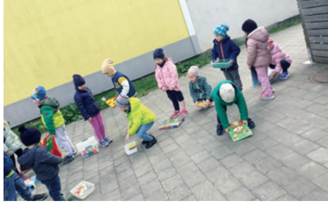
Die Kinder des Kindergartens Seibersdorf helfen fleißig beim Umzug mit

Jedes Kind durfte auch, nachdem es die leeren Räume des Feuerwehrhauses kennengelernt hatte, sein Lieblingsspiel umsiedeln. Stück für Stück wanderte so ins Feuerwehrhaus. In den Osterferien gab es die große Umsiedelung und nach den Ferien konnten die Kinder sofort im Feuerwehrkindergarten starten.