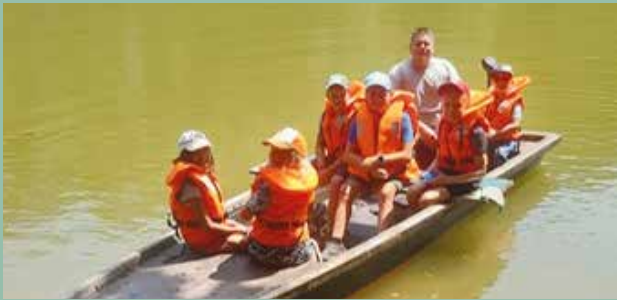
Jäger und Fischer