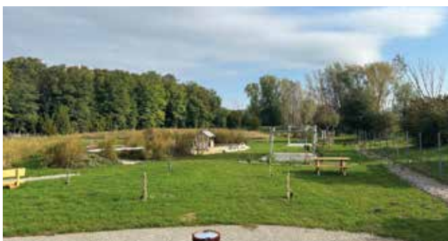
Spielplatz an der Leitha

Der Spielplatz im Siedlungsgebiet „An der Leitha“ ist geöffnet und kann ab sofort bespielt werden.