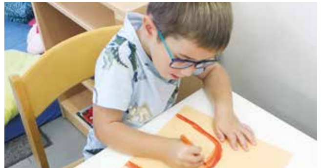
Forscher beim Erstellen der Tischunterlage in der Forscherwerkstatt

Auf ein spannendes und sicherlich wieder aufregendes Kindergartenjahr freuen wir uns schon.