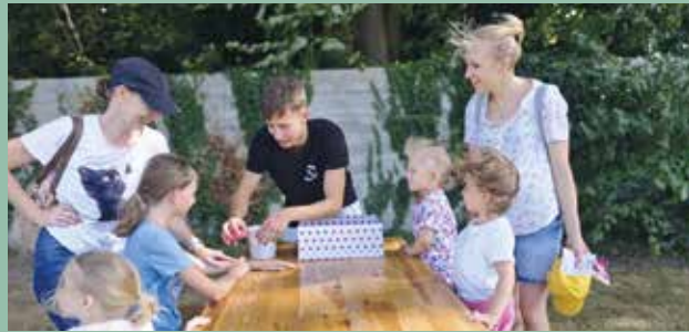
Wasserspiele am Kinderspielplatz