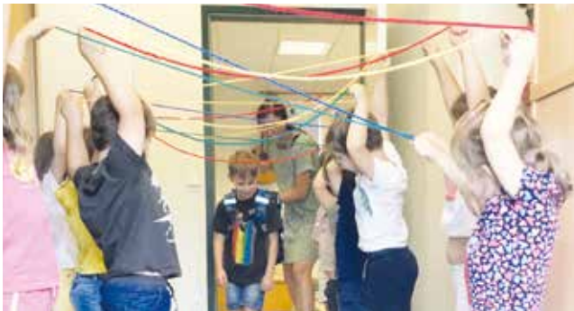
Kindergartenkinder beim „Hinauskehren“

Mit dem neuen Kindergartenjahr sind nun die nächsten Kinder zu unseren Forschern geworden. Die Kinder haben bereits die erste Forscherwerkstatt hinter sich.