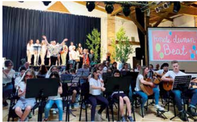
Musikschule in der Feuerwehrscheune Unterwaltersdorf

Tiefe. Die Musiker unterstrichen die verschiedenen Musikstile, die die Eule auf ihrer Reise entdeckt – von Rock über Jazz bis hin zur Oper – und machten die Vorstellung zu einem abwechslungsreichen Klangerlebnis. Das geniale Orchesterarrangement stammte aus der Feder von Saxophonlehrer Werner C. Veszely. Am Ende dieses Abends bleibt die Erkenntnis, dass Musik und Theater Brücken bauen und Menschen zusammenbringen können. Der neue Musikschulverband Fischa-Leitharegion hat mit seiner Aufführung ein starkes Zeichen gesetzt und gezeigt, dass man mit Engagement und Kreativität Großes erreichen kann.