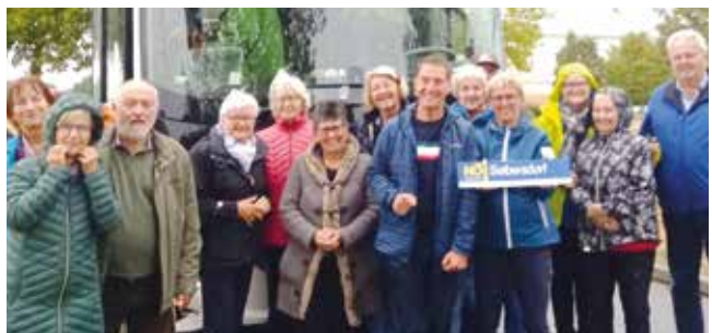
Senioren Seibersdorf bei einem ihrer Zwischenstopps

Am vierten Tag führte die Reise durch das Rhonetal zum Rhonegletscher und über den Grimselpass nach Luzern. Auf der Heimreise über den Arlberg ließen die Teilnehmer die vielen Erlebnisse noch einmal Revue passieren.