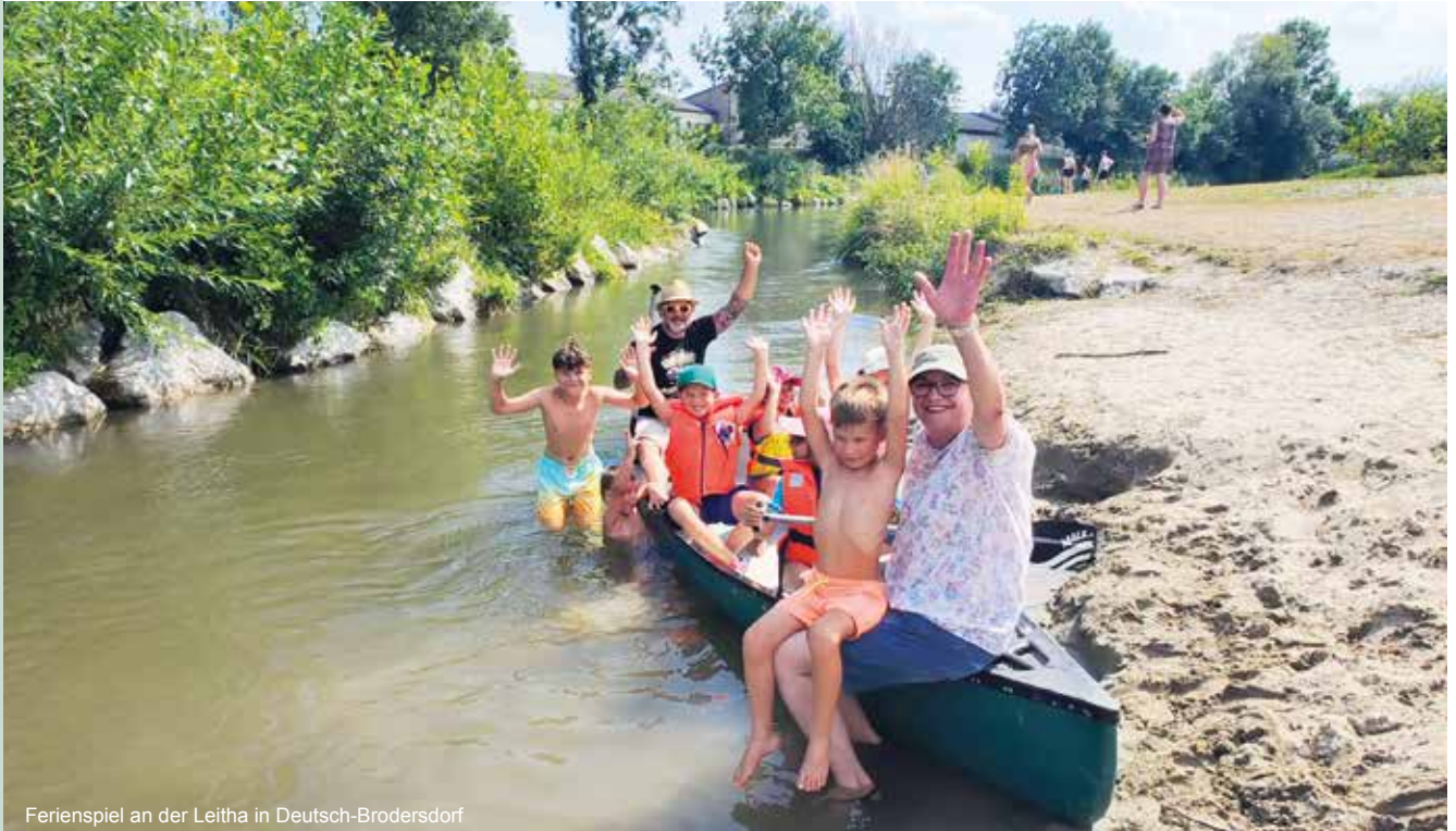
Ferienspiel an der Leitha in Deutsch-Brodersdorf

Die Bürgermeisterin und der Gemeinderat blicken auf einen aktiven Sommer zurück, mit Highlights wie dem Kanufahren auf der Leitha. In dieser Ausgabe gibt es Infos zu den Ereignissen und kommenden Projekten. Wir wünschen Ihnen eine bunte und erholsame Herbstzeit!