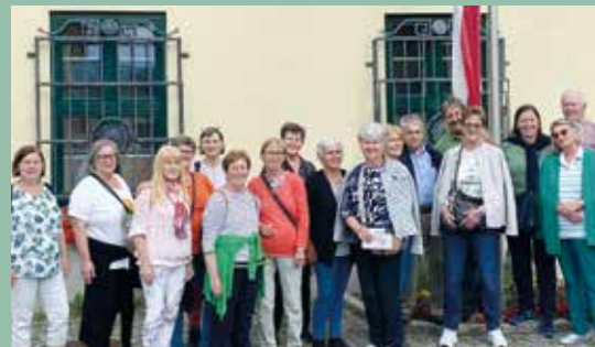
Senioren Deutsch-Brodersdorf vor dem Stadtmuseum Traiskirchen

In den vergangenen Monaten hat die Seniorengruppe Deutsch-Brodersdorf an interessanten, informativen und kulturell bereichernden Aktivitäten teilgenommen. Dazu zählten ein Vortrag zur sicheren Handynutzung, Radausflüge ins Glasmuseum und ins Heimatmuseum Ebreichsdorf, ein Besuch des Wiener Zentralfriedhofs, des Stadtmuseums Traiskirchen sowie der Seefestspiele Mörbisch mit „Fair Lady“. Selbstverständlich kam bei unseren Heurigenbesuchen und dem sehr gut besuchten Spanferkelessen das gesellige Beisammensein nicht zu kurz.