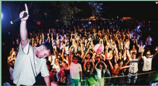
Poolparty im Sportbad Seibersdorf

Die Poolparty stellt die bedeutendste Einnahmequelle der Feuerwehr Seibersdorf dar und die Erlöse werden zur Anschaffung von Ausrüstung verwendet. Ein besonderes Dankeschön geht an die Gemeinde, die Sponsoren und die freiwilligen Helfer für die Unterstützung.