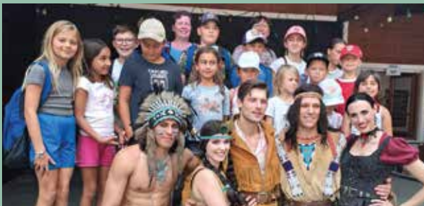
Winnetou im Steinbruch Winzendorf