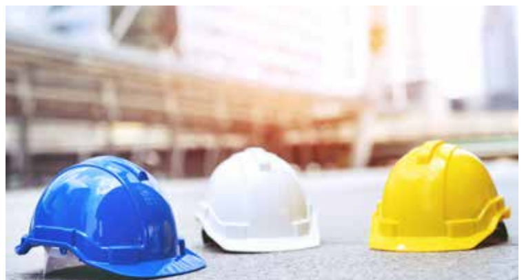
Baustelle Kindergarten und Volksschule in Seibersdorf

In den Ferien wurden die Sanitäreinrichtungen in der Volksschule Seibersdorf komplett erneuert. Für den Neubau des Kindergartens wurde bisher ein neuer Wasser- sowie Kanalananschluss hergestellt. Ende September wurden die Rohbauarbeiten für den Zubau der Volksschule abgeschlossen. Ab Oktober starten die Bauarbeiten für den Kindergartenneubau.