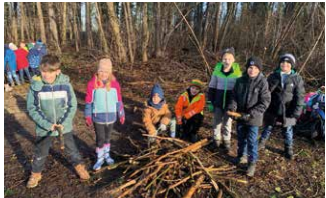
Volksschule im Wald

Sich in freier Natur bewegen, frische Luft schnappen und den Wald „vor der Haustür“ zu haben sind nur einige wenige Privilegien, die wir hier bei uns am Land genießen dürfen. Was genau z.B. auch der Wald für uns zu bieten hat, was wir dort finden und erleben können, das hat unserer 1. und 2. Kl. eine Waldpädagogin gezeigt. So wandern unsere kleinen Schützlinge 4x in diesem Schuljahr in den Wald, um diesen kostbaren, unbezahlbaren und energiereichen Naturschatz mit allen Sinnen erfahren zu können.