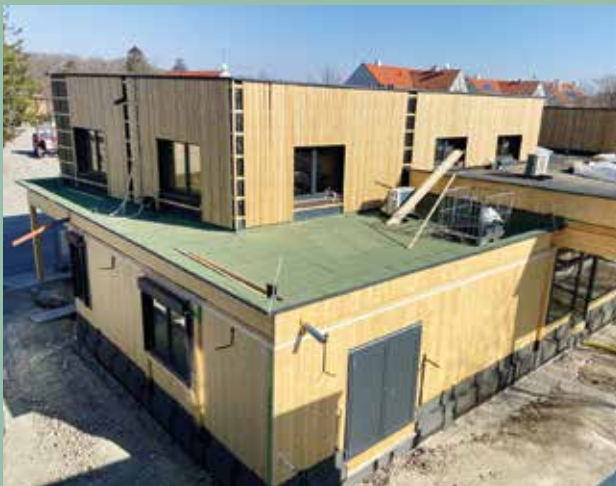
Kindergarten Seibersdorf Neubau

Die Auftragsvergabe erfolgt nach der Gemeinderatsitzung im März 2025. Die Arbeiten sollen im Zeitraum April bis Juni 2025 durchgeführt werden.