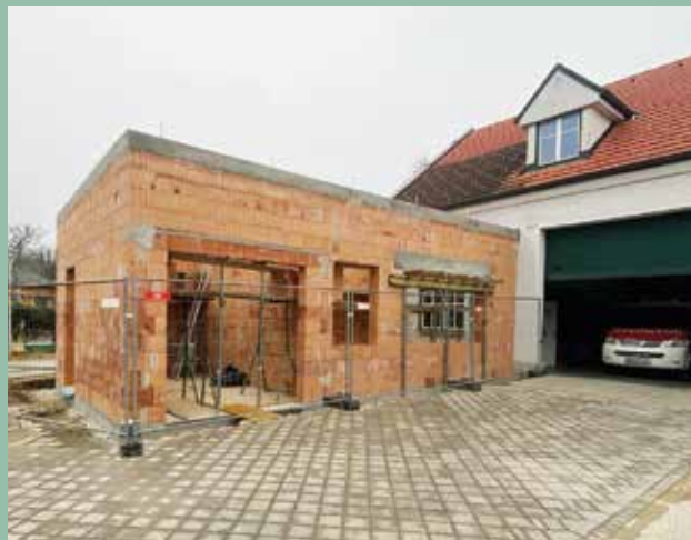
Zubau Feuerwehrhaus Seibersdorf