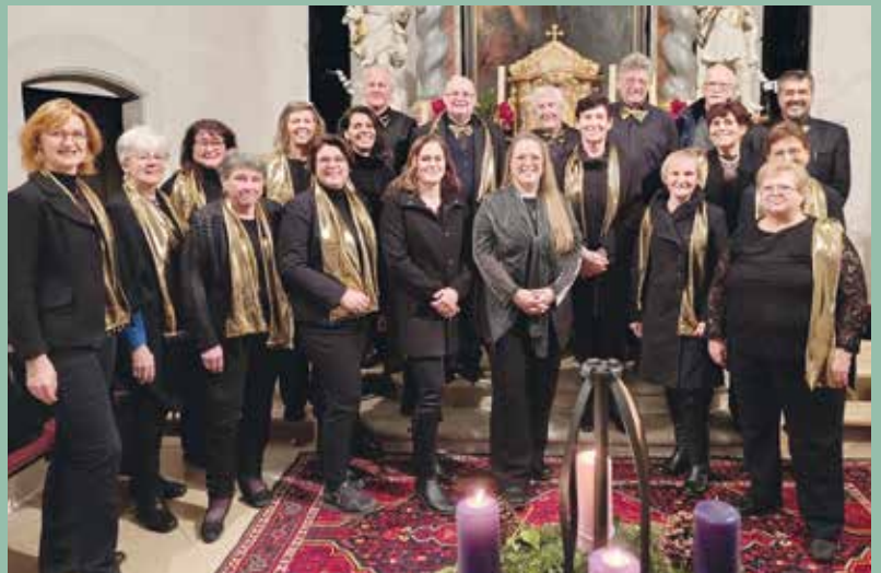
Adventsingen in der Pfarrkirche Seibersdorf

Alles in allem eine gelungene Veranstaltung, die etwas Besinnlichkeit in die hektische Vorweihnachtszeit brachte.