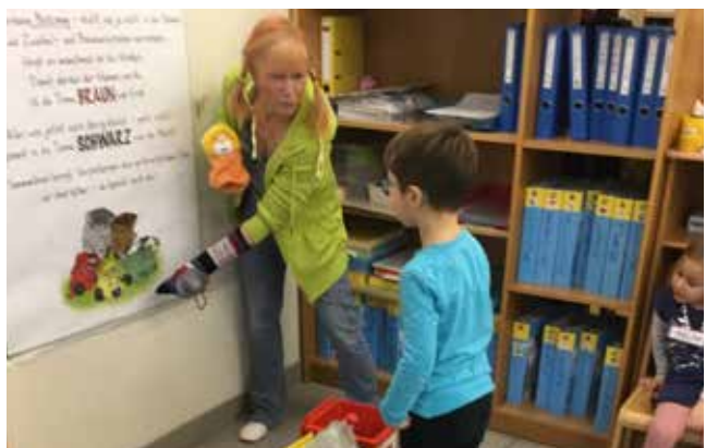
Vortrag über Mülltrennung im Kindergarten

Jetzt geht es ab in die bunte Faschingszeit, in der wir bereits mit dem Kasperl und der Prinzessin schon einiges erlebt haben. Mit vielen Tänzen, Musik und lustigen Verkleidungen freuen wir uns aufs Faschingsfest.