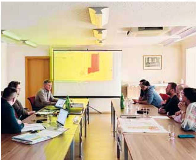
Ein Einblick in das Planungsgespräch

Ein großes Dankeschön an die Gemeinde und das Baustudio Höfer für die wertvolle Unterstützung und enge Zusammenarbeit bei diesem wichtigen Projekt!