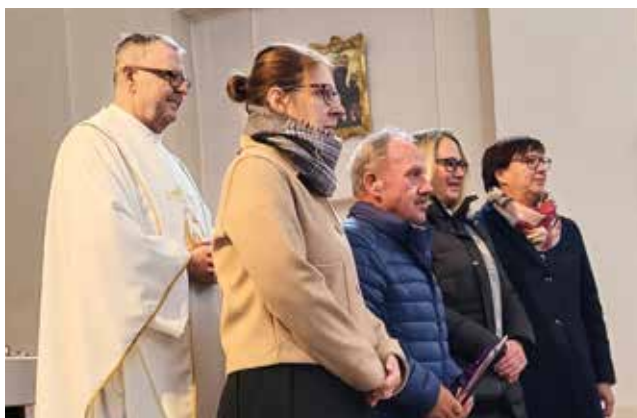
Christkönigsfest in der Pfarrkirche Deutsch-Brodersdorf