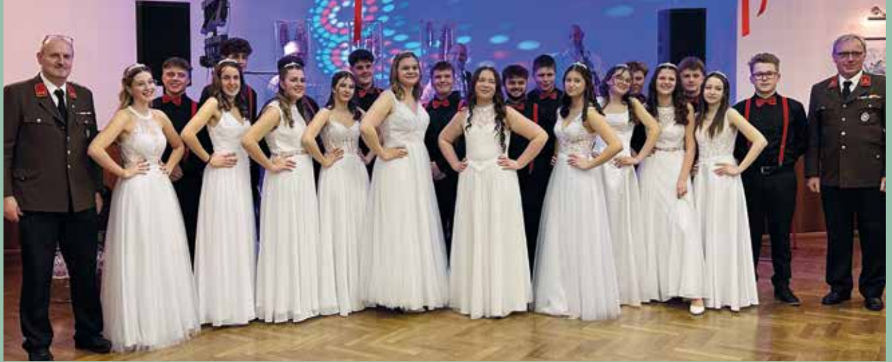
Feuerwehr Seibersdorf mit Eintänzerinnen und Eintänzer der Jugend

Die Feuerwehr Seibersdorf bedankt sich herzlich bei den zahlreichen Gästen, dem Gasthaus Hirschbeck, sowie der Jugend Deutsch-Brodersdorf/Seibersdorf.