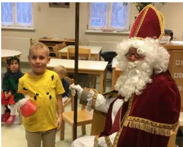
Nikolaus zu Besuch im Kindergarten

Traditionell feierten wir im Dezember viele Feste im Kindergarten Seibersdorf. Angefangen mit dem Nikolausfest bis hin zum vorweihnachtlichen Fest, dauerte die Wartezeit auf das Christkind dann nicht mehr so lange. Auch der Wichtel verkürzte die Wartezeit und schaute täglich im Kindergarten vorbei. Gleich nach den Weihnachtsferien begrüßten wir das neue Jahr auch im Kindergarten.